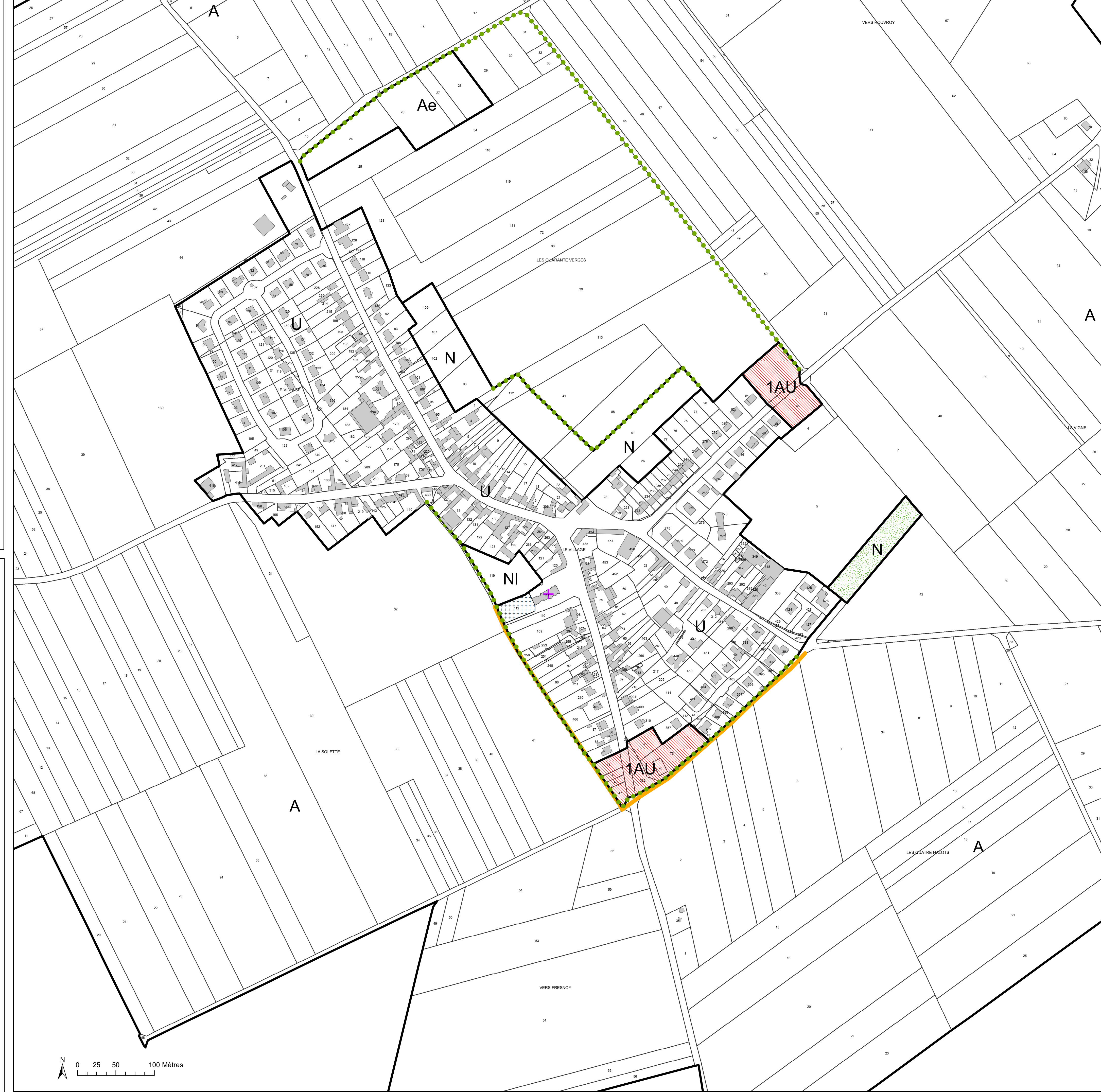
Plan de zonage échelle 1/2500